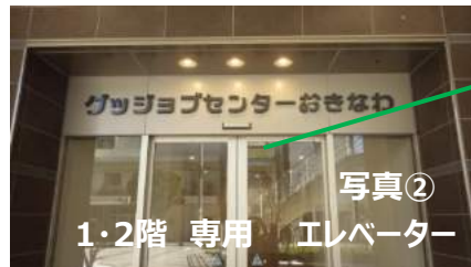
写真② 1・2階 専用 エレベーター

バスおりばD近くの階段(写真①)で2階へ 2階グッジョブセンター専用エレベーター ⇒ 6階(写真②)