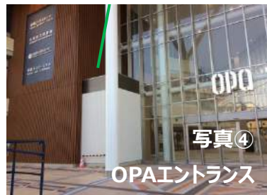
写真④ OPAエントランス

モルレル旭橋駅で降車 → 改札口より連絡橋を通る → OPAエントランス(2階、写真④)に出ます → 国際通り方面へ向かうと2階専用エレベーター有(写真②)(沖縄観光情報センター横) ⇒ 6階