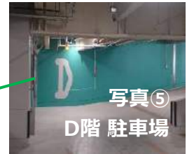
写真⑤ D階 駐車場