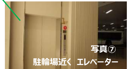
写真⑦ 駐輪場近く エレベーター