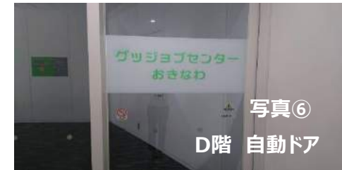
写真⑥ D階 自動ドア

【D階以外へ駐車の場合】①②方法有 ① 駐車場フロアのエレベーターでD階へ ② 上記のエレベーターで2階まで下りて2階専用エレベーターから6階へ(写真②)